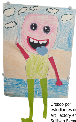
Creado por estudiantes de The Art Factory en New Sullivan Elementary